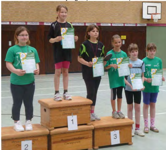
Mädchen 2003/04 (14 Teilnehmer)