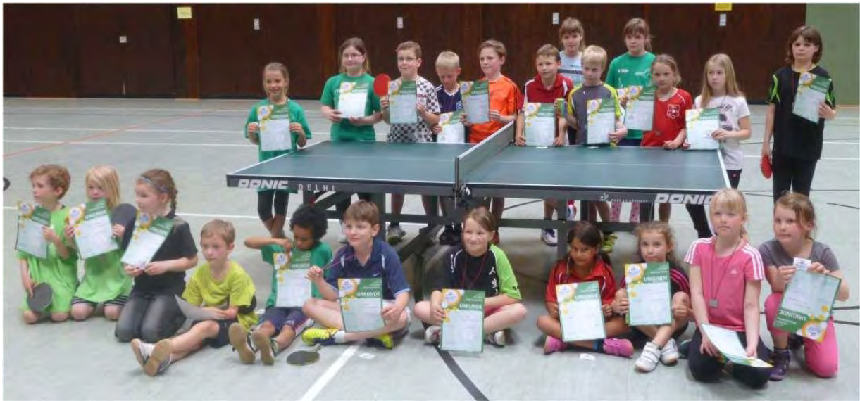
Die Plätze 1 – 4 alle 4 Altersgruppen