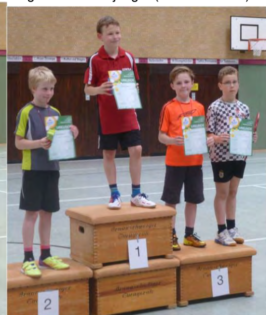
Jungen 2003/04 (12 Teilnehmer)