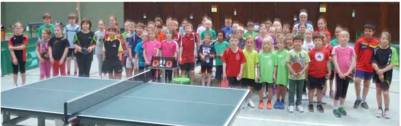
Alle Teilnehmer Bezirksentscheid 2014