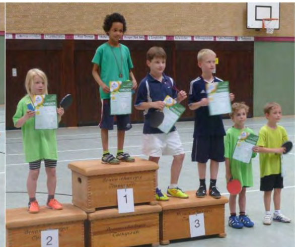
Jungen 2005 und jünger (16 Teilnehmer)