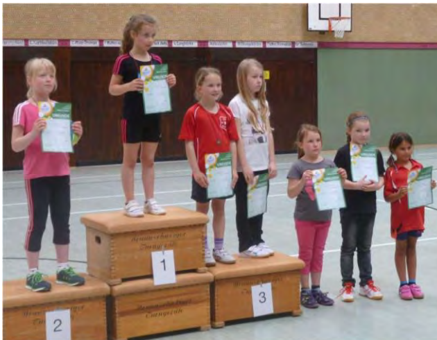
Mädchen 2005 und jünger (16 Teilnehmer)