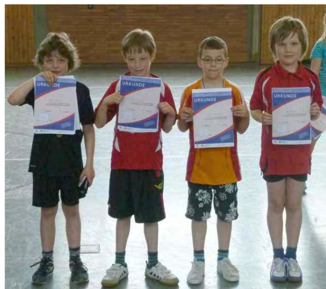
Jungen Jahrgang 2003