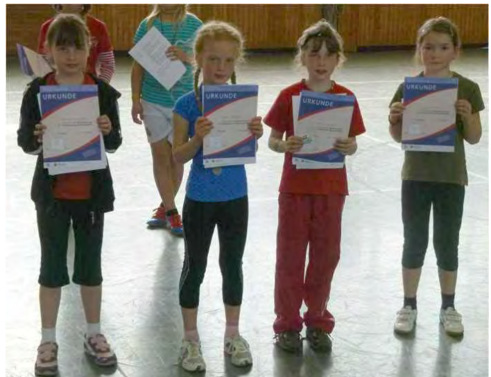
Mädchen Jahrgang 2003