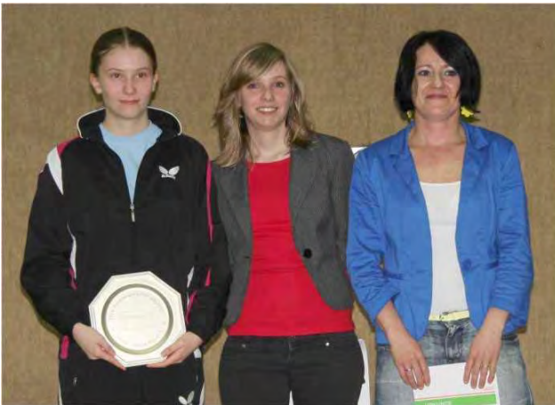
Damen A_TSV Watenbüttel