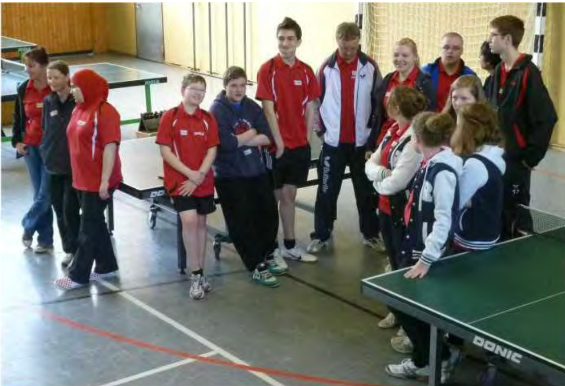
Die Helfer des TSV Rünigen