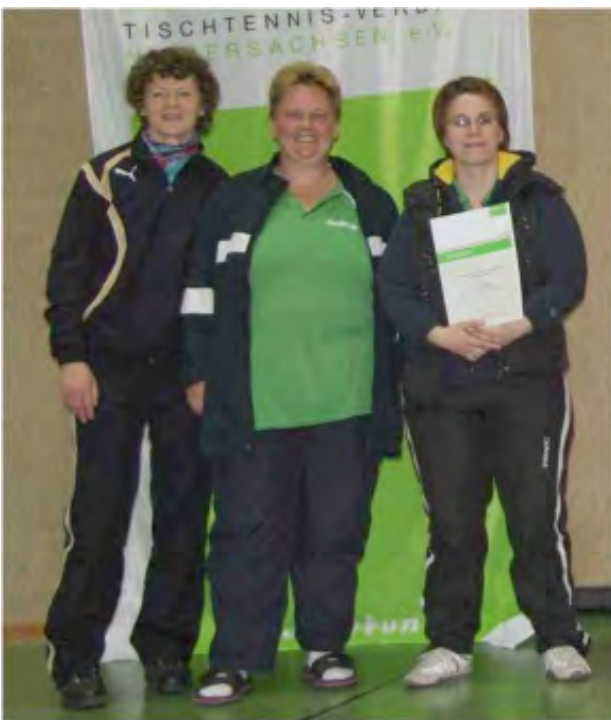
Damen D_2. Platz: BV Wettmar