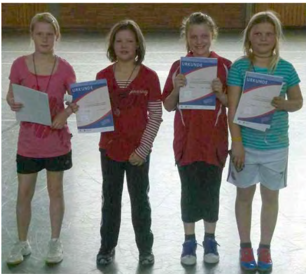
Mädchen Jahrgang 2001/02