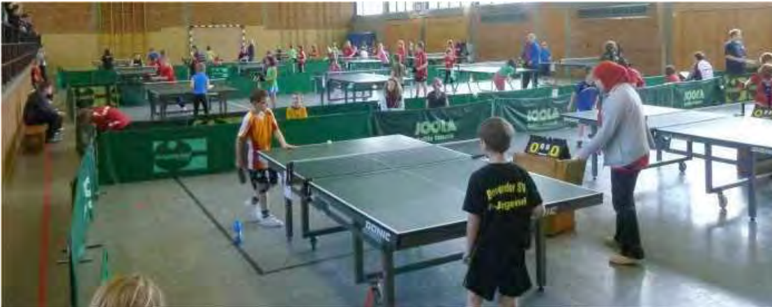
Eindruck von den Spielen