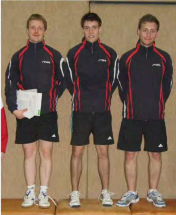
Herren A_1. Platz: RSV Braunschweig