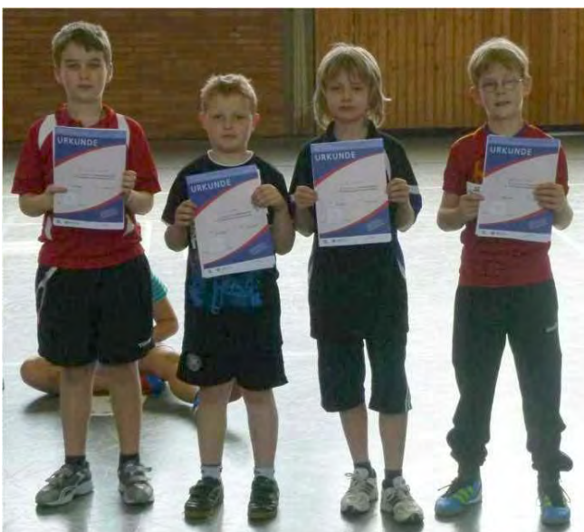
Jungen Jahrgang 2001/02