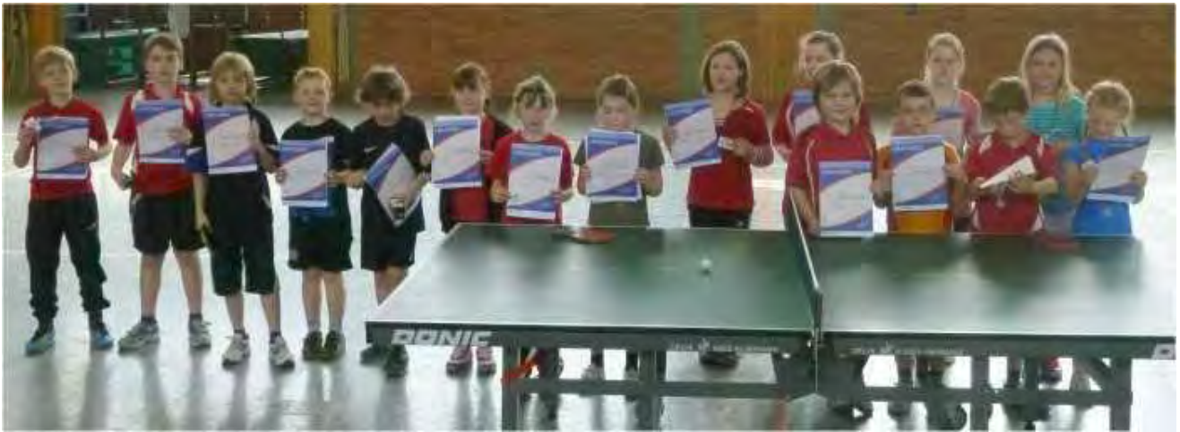
Die Sieger zusammen