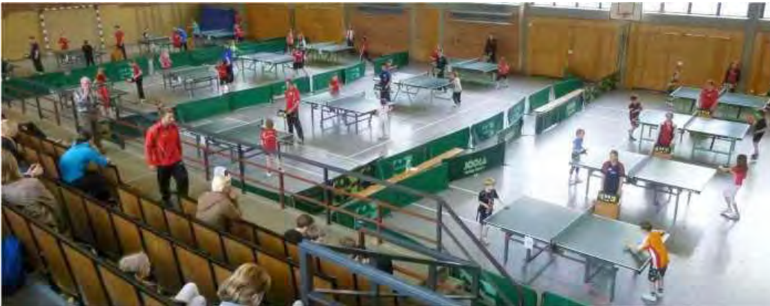
Eindruck von den Spielen