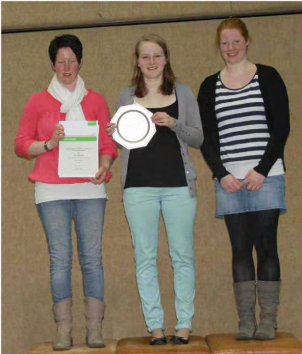
Damen D_1. Platz: SC Glandorf