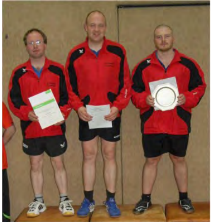
Herren D_1. Platz: SV Wesseln