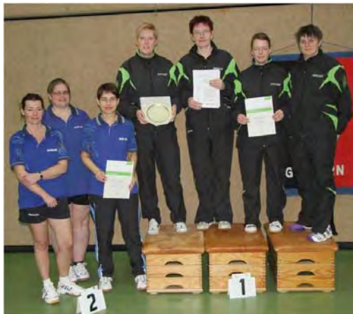
Damen B: 1. SV Union Meppen, 2. TSV Fortuna Oberg